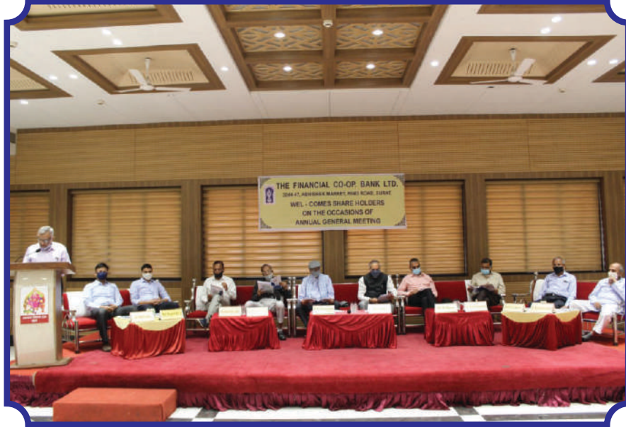
બેંકની ૨૨મી વાર્ષિક સાધારણ સભામાં બિરાજમાન બેંકના માન. ડાયરેક્ટરશ્રીઓ અને મેનેજરશ્રી