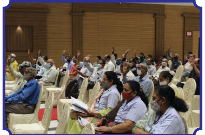
બેંકની ૨૨મી વાર્ષિક સાધારણ સભામાં બિરાજમાન ઠરાવોને મંજૂરી આપતાં માનનીય સભાસદશ્રીઓ