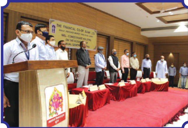
કોરોનાકાળ દરમ્યાન મૃત્યુ પામનાર પ્રજાજનોને શ્રદ્ધાંજલિ આપતાં બેંકના સંચાલક મંડળના સભ્યો