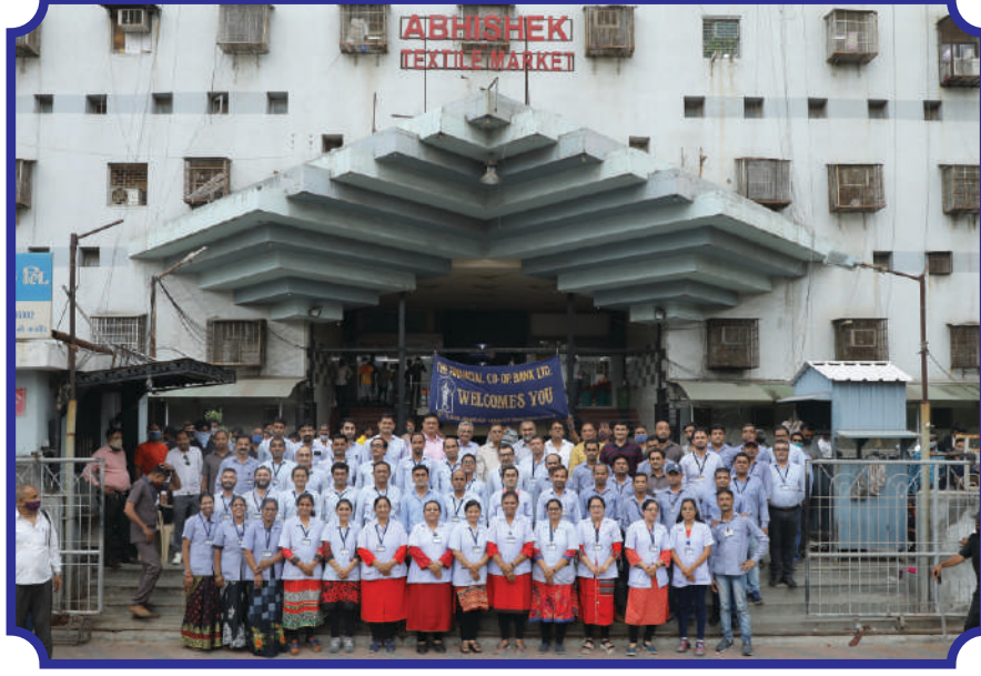
બેંકની મુખ્ય શાખા (અભિષેક માર્કેટ) ખાતે બેંકના પ્રવર્તમાન બોર્ડ ઓફ ડાયરેક્ટરશ્રીઓ, અધિકારીશ્રીઓ, મેનેજરશ્રીઓ અને કર્મચારીગણ