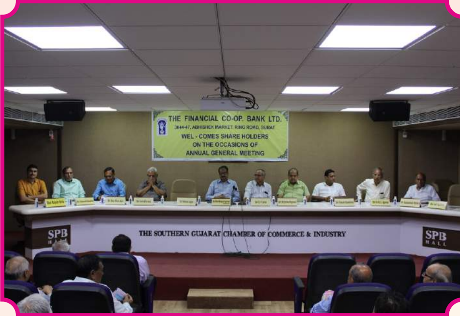
બેંકની ૨૧મી વાર્ષિક સાધારણ સભામાં બિરાજમાન બેંકના માન. ડાયરેક્ટરશ્રીઓ.